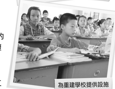
為重建學校提供設施